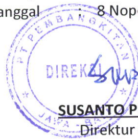
SUSANTO PURNOMO Direktur Utama